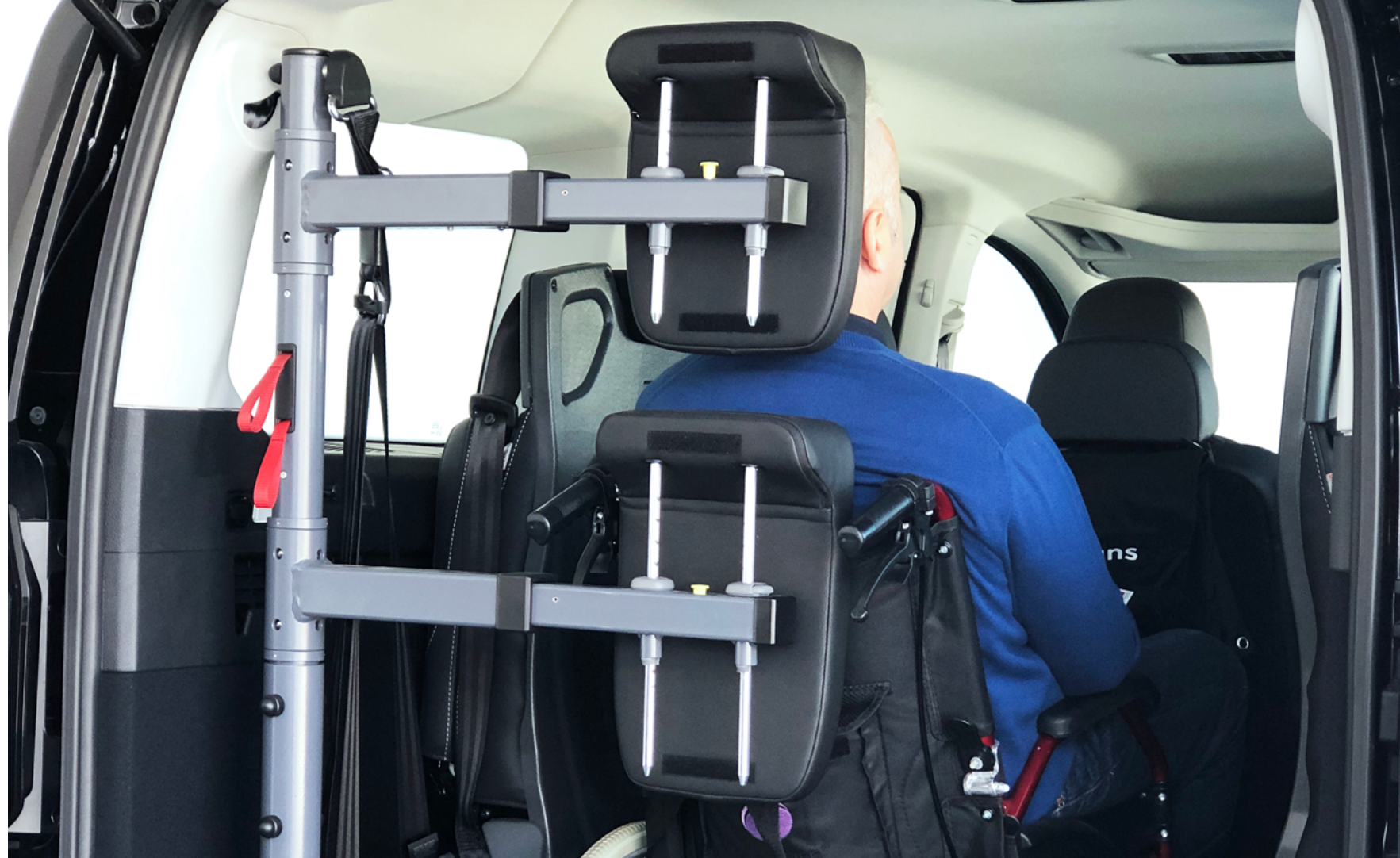
Paquete Accesibilidad UNE (X50)

Incluye 2 asientos giratorios y abatibles en la tercera fila de asientos compatibles con el acceso para Silla de Ruedas.