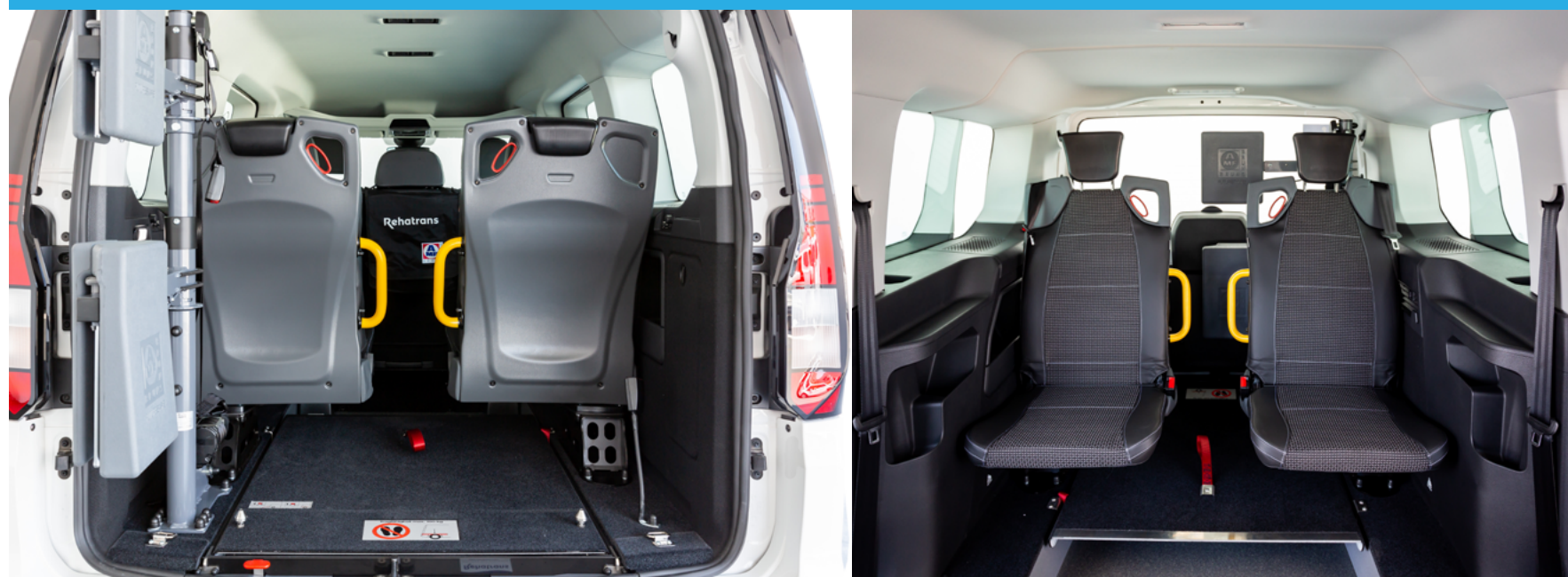
Paquete 7 Plazas (X51)